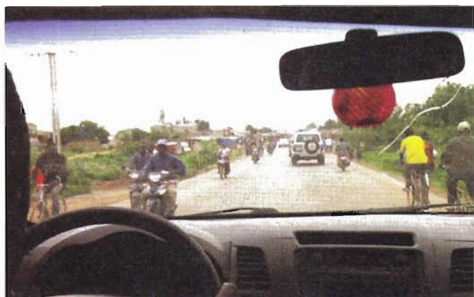
Trafic fluide et slalom entre 2-roues

Ce qui frappe d'emblée le visiteur occidental, c'est l'extraordinaire énergie qui se manifeste partout. La jeunesse de la population y est pour beaucoup mais il y a plus que cela. Quand la vie peut s'arrêter sans préavis par une maladie, ailleurs bénigne et ici simplement mal soignée, par un accident de circulation - chauffeur local indispensable -, quand tout paraît fragile, la réaction est de vivre l'instant avec intensité.