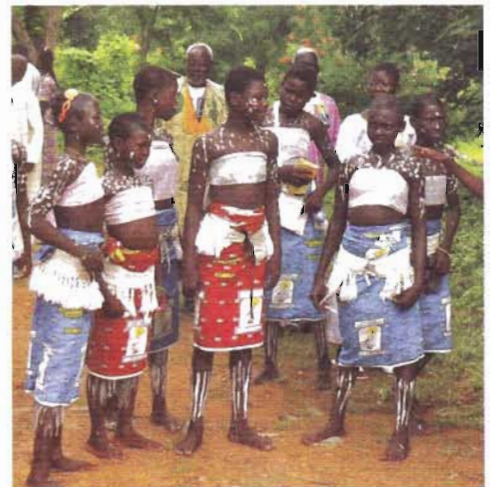
Tenue traditionnelle pour la procession

Cette énergie se manifeste aussi par le dévouement et l'imagination des associations locales qui comblent les carences des pouvoirs publics. Nous avons pu découvrir l'action de religieuses tenant un hôpital pour enfants, parler à un médecin assurant le suivi des séropositifs et travaillant à la prévention contre le Sida, admirer le travail d'une association de développement et d'éducation. L'Afrique bouge parce que les africains la font bouger.