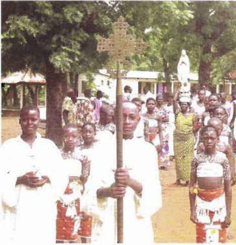
La procession se met en place