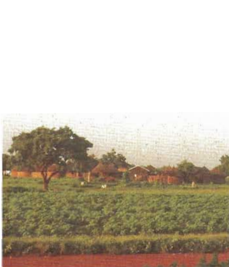
Village sur le chemin du Sud

Concert au profit de l'association ADESDIDA (Aide au Diocèse de Dapaong), dimanche 11 octobre à 15h église St François de Sales 6 rue Brémontier