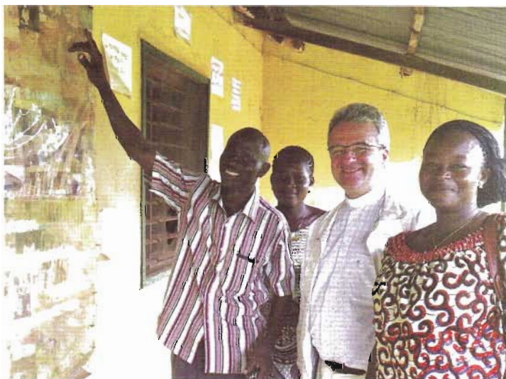
Association le Phare d'Aide au Développement

Cette grâce de Dieu qui n'abandonne jamais ses enfants et permet une réparation express, un dimanche après-midi au milieu de nulle part, par les vertus conjuguées du téléphone portable, d'un mécano local, et d'une pièce de rechange convoyée par « un taxi-brousse devant passer par là ». En 6h le tour était joué. Imaginerions-nous la même efficacité en France ? Bon, il est vrai que chez nous le concept de « panne de voiture » tend à disparaître, mais ça en est presque dommage.