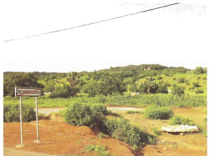
Adieu Bombouaka !

Ici l'évangile a encore des airs de jeunesse. Dans le diocèse de Dapaong l'évangile est arrivé il y a environ 100 ans. Sa nouveauté est vraiment perceptible quand les nouveaux baptisés, en majorité des adultes, doivent accompagner leur baptême d'un changement de vie radical. Tout en continuant à vivre dans un environnement et des familles où les cultes traditionnels sont encore bien présents. Moins visibles cependant que les mosquées construites