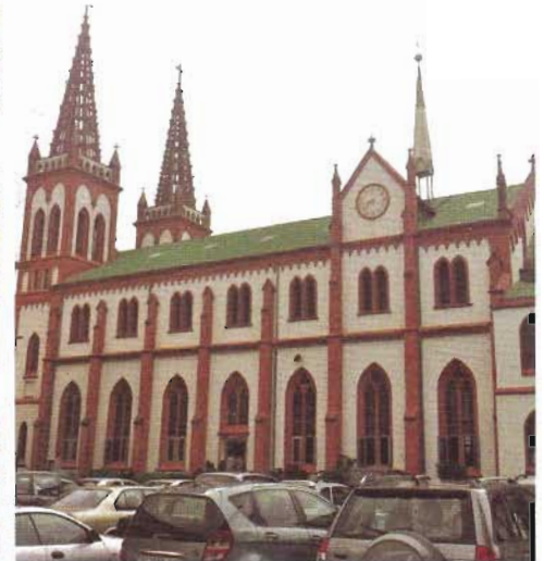
Cathédrale de Lomé

par Kadhafi dans tous les villages qui jalonnent la « grand route » qui traverse le pays du Nord au Sud. Une chose est sûre : le « fait religieux » n'est pas chassé de l'espace public et c'est assez plaisant à vivre, finalement.