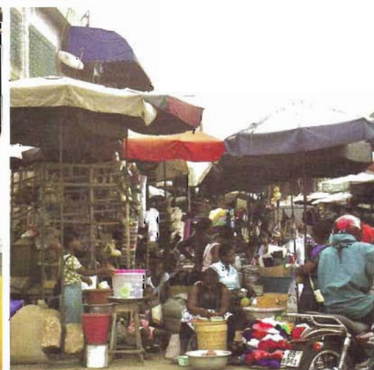
en sortant de la cathédrale