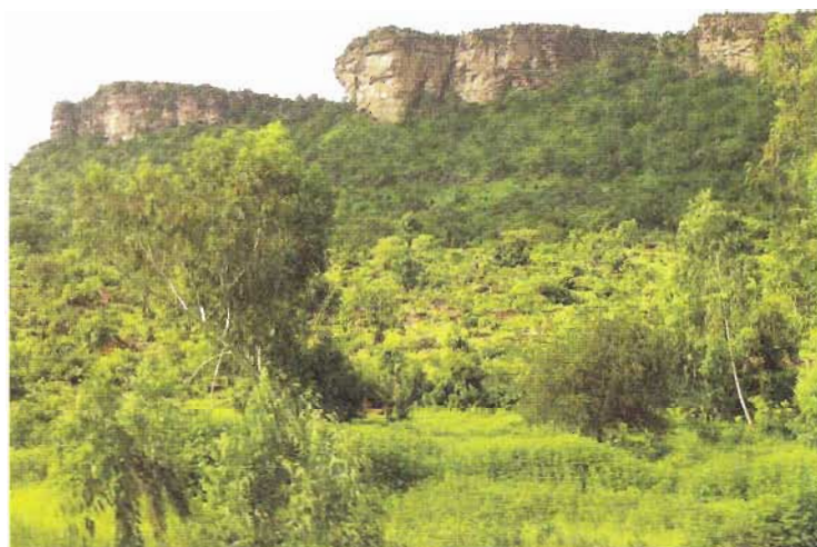
La campagne entre Dapaong et Bombouaka

bouaka le 15 Août. Descente en deux jours vers la capitale Lomé sur la côte du Golfe de Guinée avec une étape au foyer de charité d'Aledjo. Séjour à Lomé et départ le 21 vers Paris.